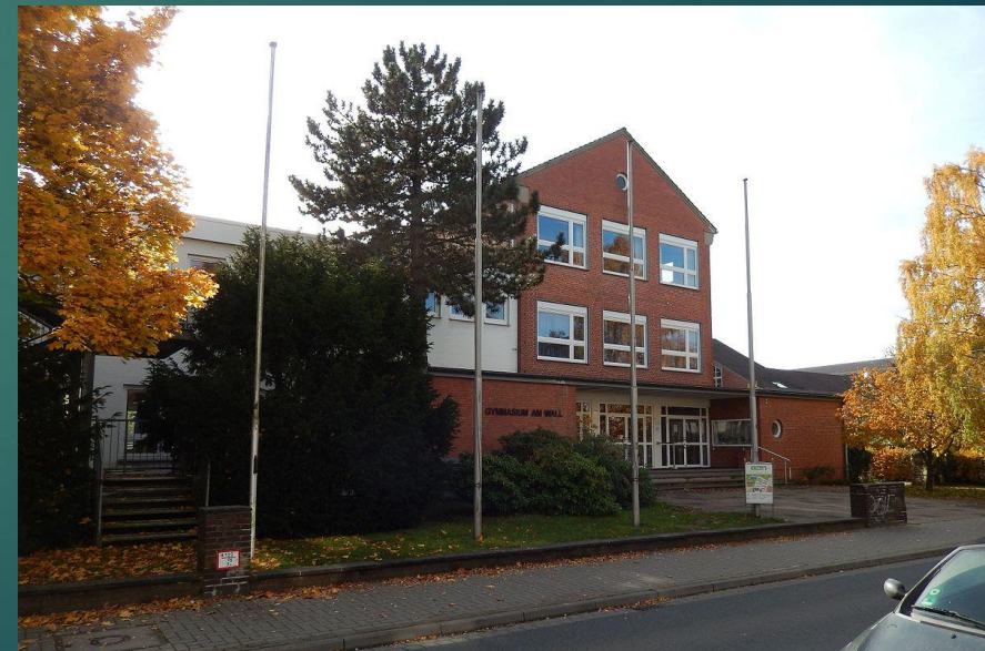
Gymnasium am Wall