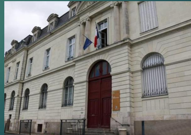
Lycée Duplessis Mornay